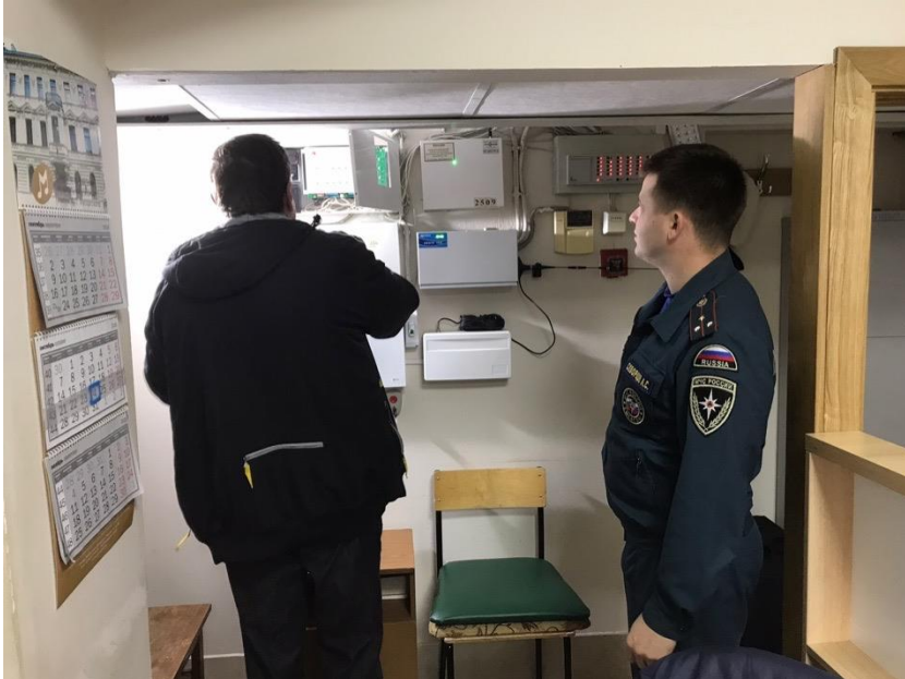
ОНДПР Центрального района 16.01.2020