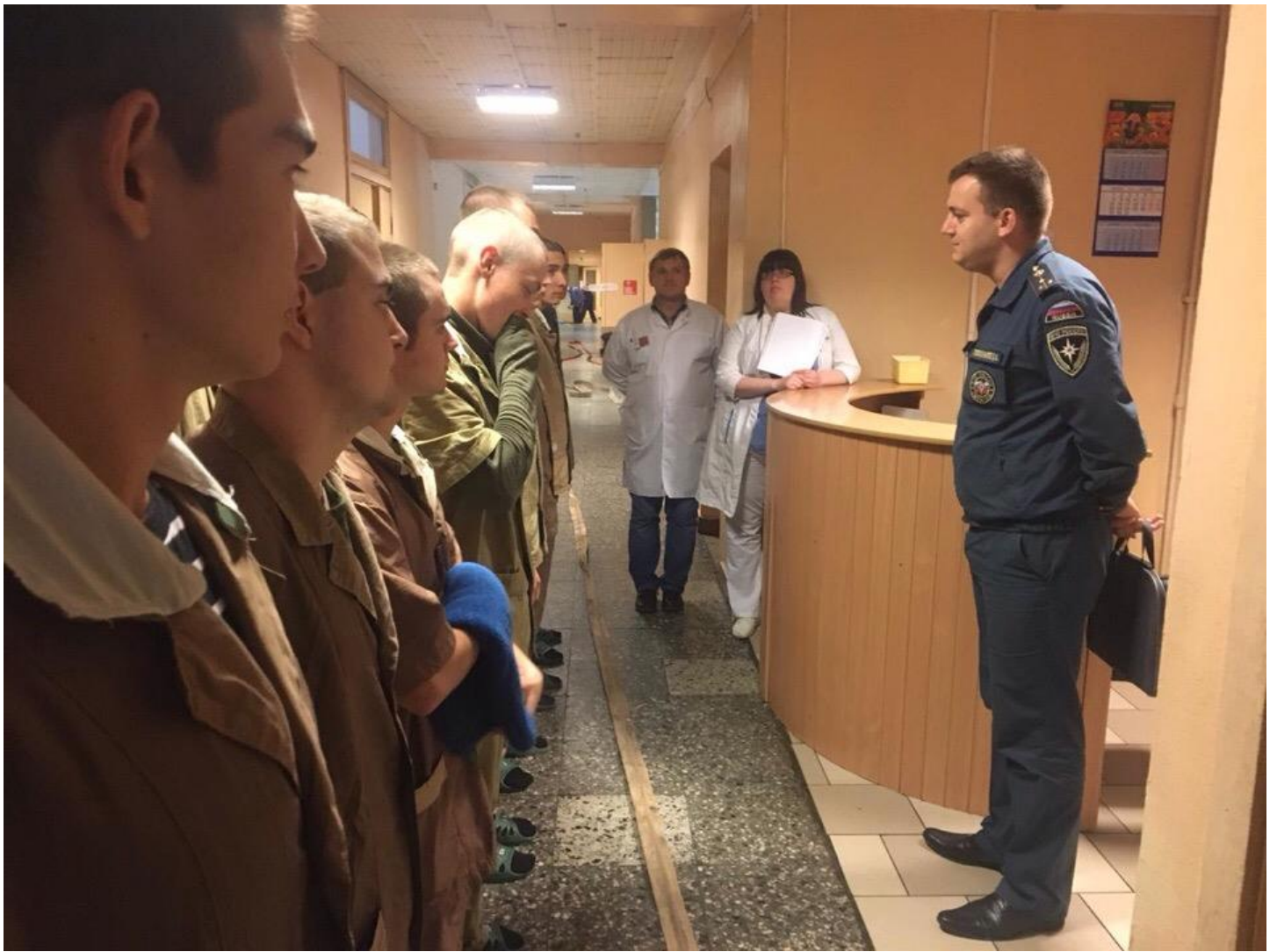
ОНДПР Центрального района 19.11.2018г.