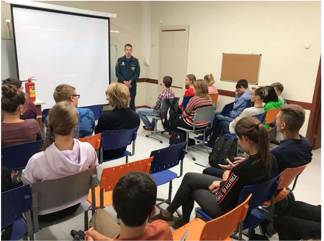
ОНДПР Центрального района ГУ МЧС России по Санкт-Петербургу 23.10.2018г.